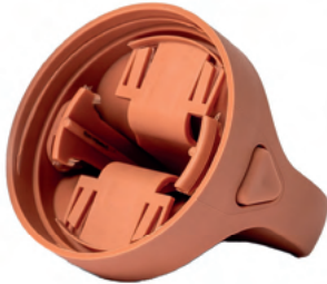
Bouchon PP/RPP En 2 pièces