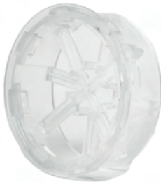
Cupule 100% RPET Pièce de maintien de la formule